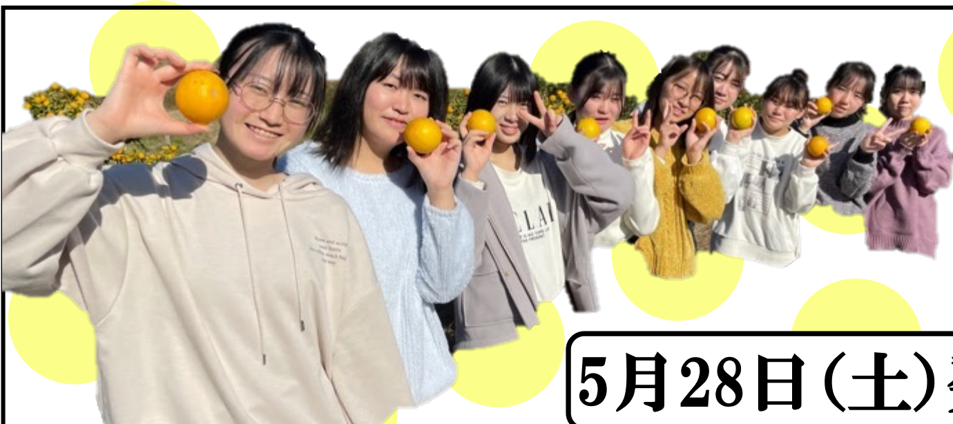
静岡県立掛川西高校 食物研究部の皆さん